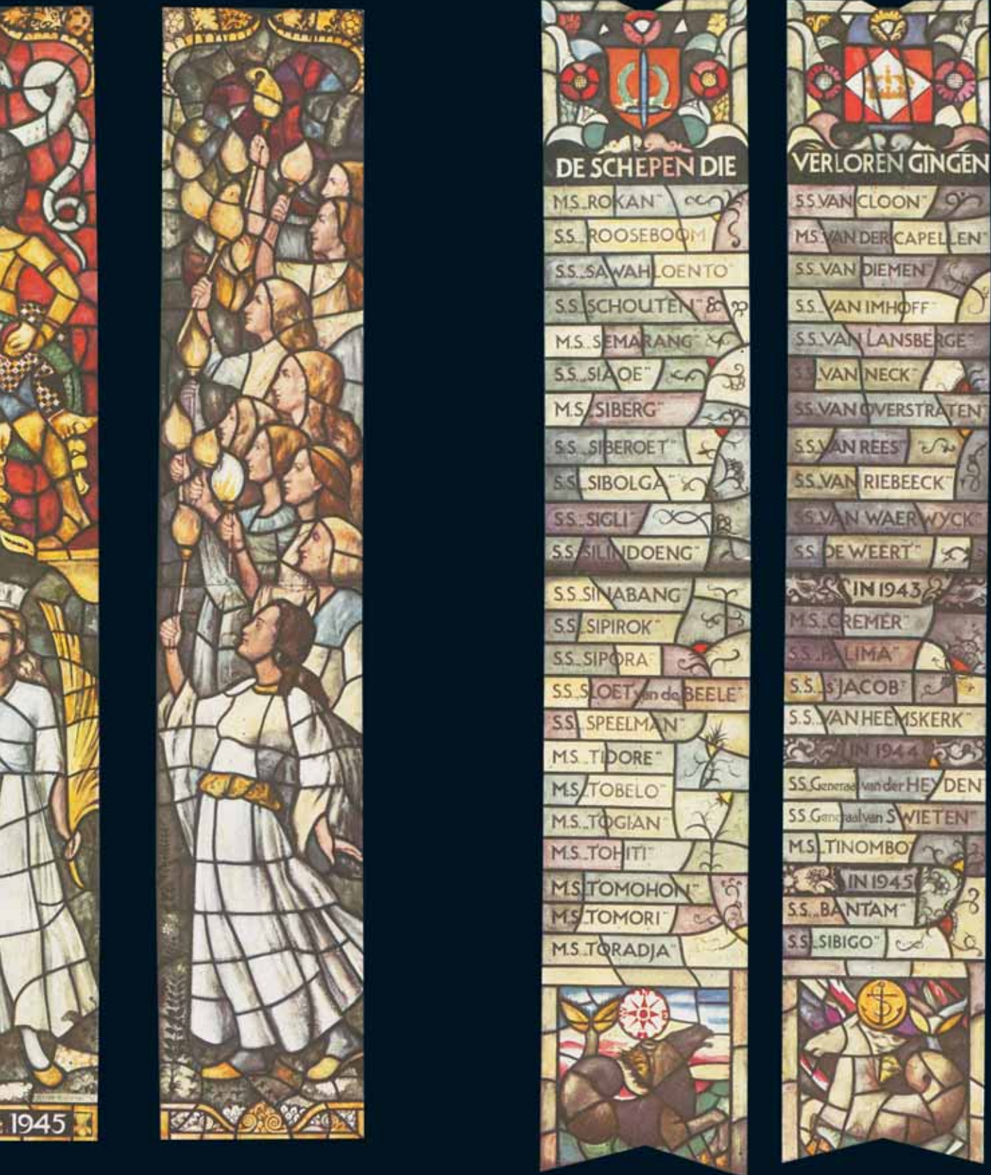
Op het voetstuk stond de tekst: 'Aan allen die ons zijn ontvallen in ongelijke strijd, of omgekomen door ontbering in 't wrede kamp der internering ter nagedachtenis gewijd. 1940-1945'. De koker is bij het verlaten van het pand (en Indonesië) in 1958 meegenomen en terechtgekomen in een nieuw, veel kleiner monument dat eerst in het Scheepvaarthuis te Amsterdam heeft gestaan en later is verhuisd naar de Prins Hendrikstichting te Egmond. Daar heeft het een plaats naast een gedenkbord (zonder namen) in het Engels en Chinees van de Java-China-Japan Lijn dat afkomstig is uit het hoofdkantoor van opvolger Koninklijke Java China Paketvaart Lijnen (KJCP), internationaal bekend als Royal Interocean Lines (RIL).